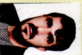
President / رئيس / نبيح الله وزيری

تصديق کيږي دا جواز چې نوم يې بورسه پلا شوی دی، د محدود المسوئليت شرکتونو د قانون او د افغانستان د نورو نافذه قوانينو پر بنسټ ثبت او صادر شوی. تصديق ميگر دد این جواز که نم ان در فوق ذکر مييشد، در مطابقت با قانون شرکتهاي محلي والمسوليت و سایر قوانین نافذه افغانستان ثبت و صادر گردیده است.